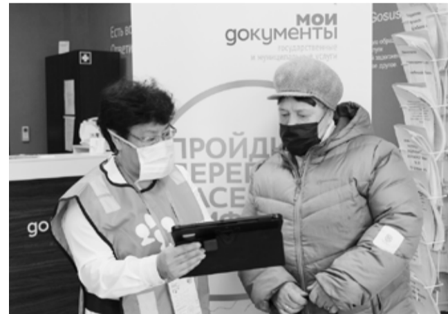
Александр Мордвинов, глава Локомотивного городского округа

мости связан с тем, что идет поддержка и развитие программы по демографии по инициативе президента: детские выплаты, материнский капитал, которые положительно сказываются на увеличении численности населения.